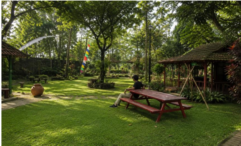
Gambar 10. Desa Wisata Cinangneng