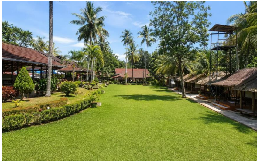
Gambar 4. Desa Wisata Situ Gantung