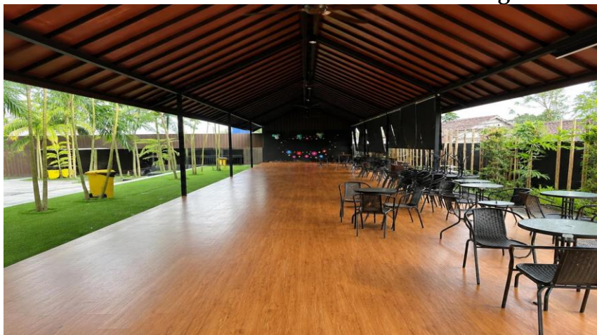
Gambar 5. Desa Wisata Pagedangan