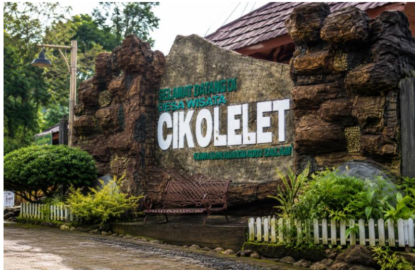
Gambar 7. Desa Wisata Cikolelet