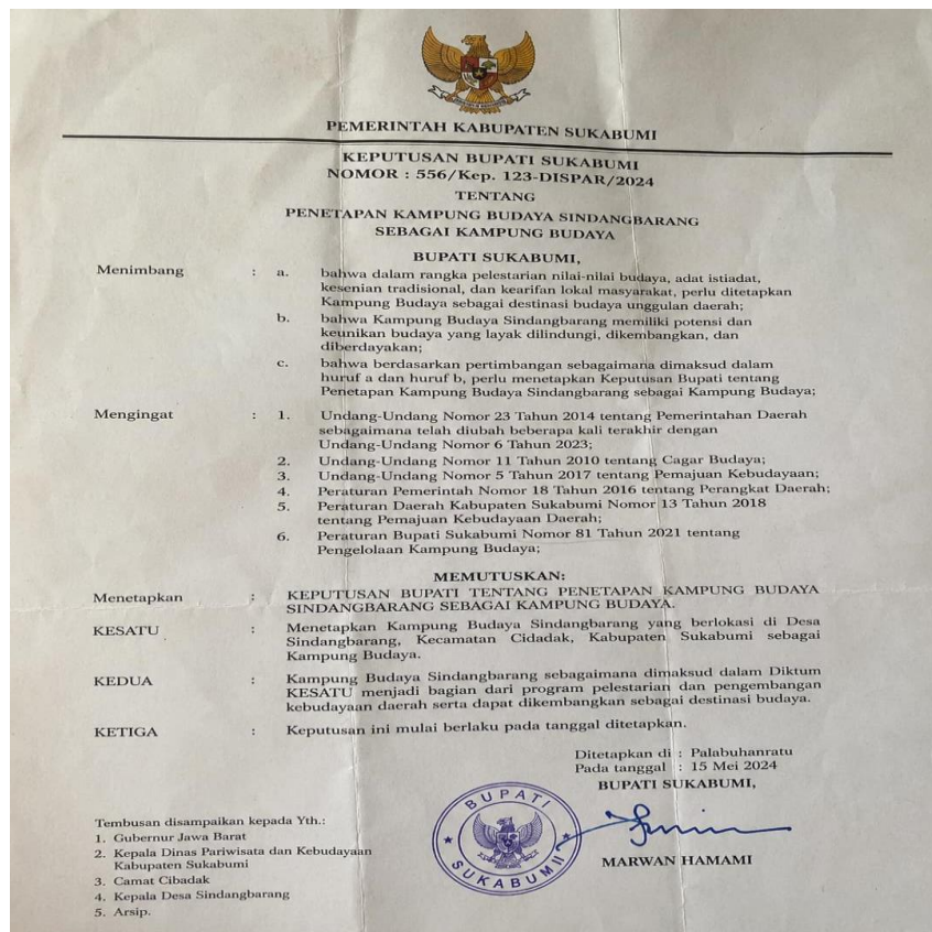
Gambar 13. Legalitas Kampung Budaya Sindangbarang