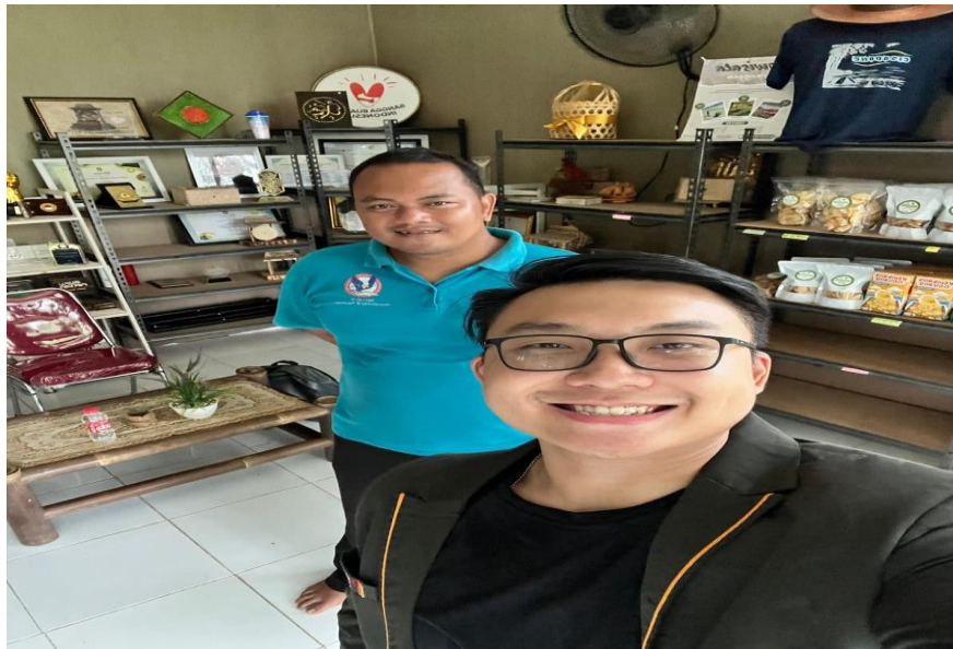
Gambar 2. Wawancara dengan pengelola Kampung Ekowisata Keranggan