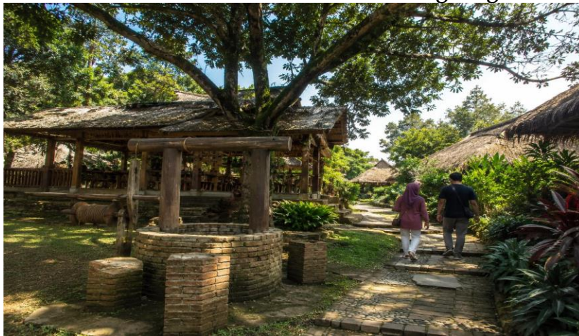
Gambar 11. Desa Wisata Koneng