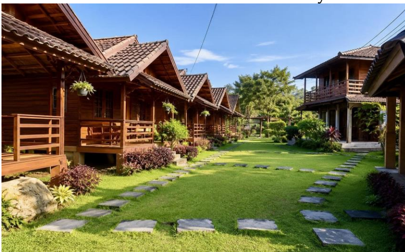
Gambar 9. Desa Wisata Sawarna