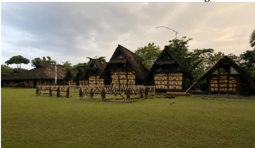
Gambar 12. Kampung Budaya Sindabarang