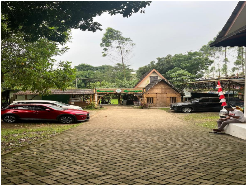
Gambar 1. Area Kampung Ekowisata Ker