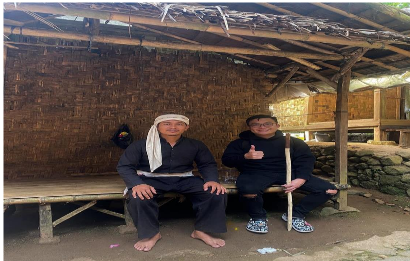
Gambar 8. Desa Wisata Baduy